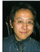
堤(財)西宮くすの木会理事長