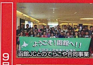
函館JCとのてらこや合同事業