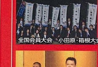
全国会員大会 小田原・箱根大会