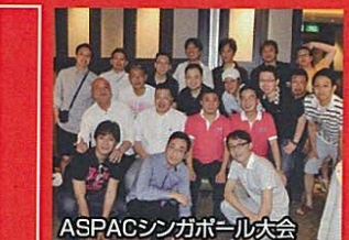
ASPACシンガポール大会