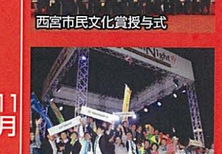
西宮市民文化賞授与式