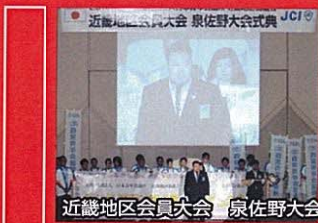
近畿地区会員大会 泉佐野大会