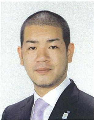
社団法人 西宮青年会議所 第 61 代理事長予定者

行動をされたのです。これからの人生に良い影響が無いはずはありません。そして 12 月 11 日。一張羅をまとい、晴れやかな表情の中にも照れ笑いを浮かべ、真剣に取り組んだ勲章である美しい涙さえ流し、このステージに辿り着かれました。20 代 30 代は、自分という人格を確立する大事な時期です。そこで JC を選択されたあなたが間違っていなかったことを今後も現役の責任のもと示し続けます。また、「私は西宮 JC の OB です。」と胸を張って言っていただけるような運動展開の継続を約束致します。難しくはありません、あなたから学んだ通りに実践するだけですから・・・。ご卒業おめでとうございます。