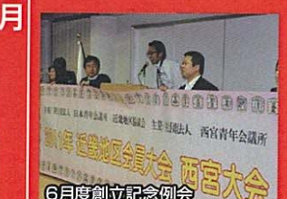
6月度創立記念例会