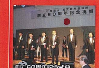
創立60周年記念式典