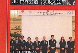
JCI世界会議 大阪大会