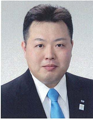
社会法人西宮青年会議所 第60代 理事長