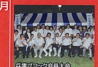
兵庫ブロック会員大会