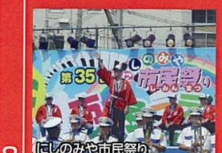
にしのみや市民祭り