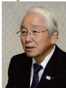
兵庫県知事 井戸敏三