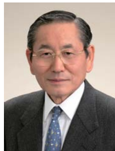
西宮市教育長 眞鍋昭治

最後に、西宮青年会議所の益々のご発展と皆さま方のご健勝を心から祈念申し上げ、年頭のご挨拶とさせていただきます。